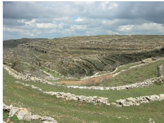
Cel incert i feixes revestint les muntanyes en l'etapa del Ports