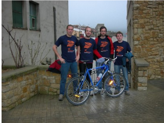
L'Alt Maestrat. Pujant a Culla i retrat "oficial" de l'expedició a Benassal

L'arribada a Culla és com fer un port de muntanya. Realment no podia estar més amunt.