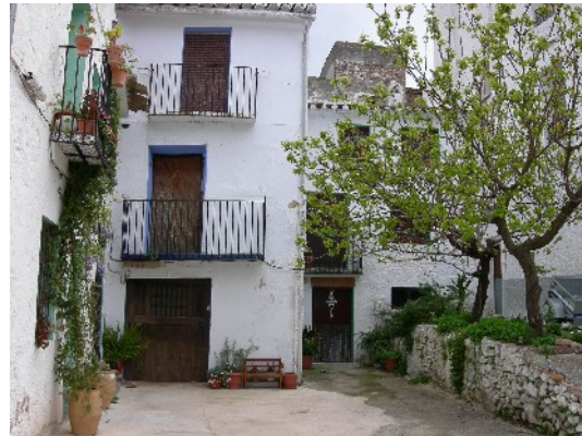
Les rampes que menen al port d'Eslida i el poble d'Aín, a la serra d'Espadà