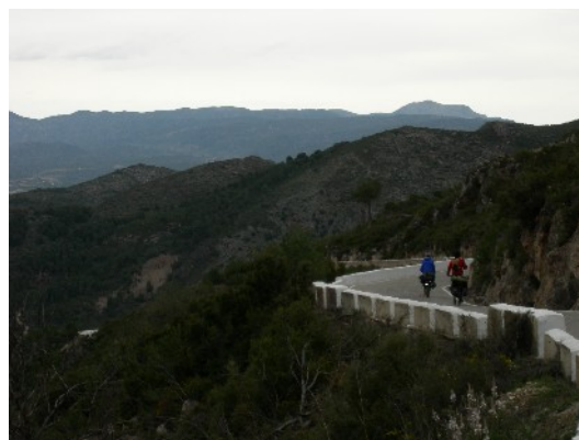
La Serra de Benicadell separa les comarques d'El Comtat i la Vall d'Albaida

Al País Valencià destaca la importància justificada que s'otorga a les fonts. A cada poble es possible abastir-se d'aigüa, i a més en unes fonts sovint de gran bellesa. Castelló de Rugat n'és un exemple, amb 11 rajos i situada al costat d'un molt ben conservat safareig. Travessem la Pobla del Duc, on destaca l'aparició de vinyes i arribem a Benigànim on hi ha unes cridaneres pancartes del partit feixista Coalició Valencina, martell d'heretges catalanistes. De fet amb això, els Països catalans cada cop ens assemblem més. Al Principat també tenim un partit que vol destruir-nos com a nació. Uns es disfressen de valencianistes i altres de defensors del bilingüisme, tot per dissimular el seu ferotge nacionalisme espanyol. Novament la resposta passa per enfortir-nos com a poble i creure en nosaltres mateixos.