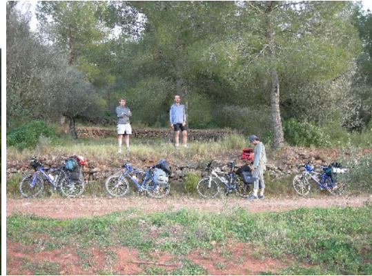
Plantació de taronjers i plantada de bicicletes al final d'etapa prop d'Algar de Palància

Creuem el Palància, l'orografia predominant són els turons, tapissats majoritàriament de bosc però alternat amb conreus. Dues agricultures de muntanya conviuen, una tradicional d'oliveres i ametllers amb petites parcel·les i una plantació de taronjers fruit d'una rompuda recent, que ha ajuntat camps i s'explota seguint conceptes moderns més propis d'empresa agroalimentària.