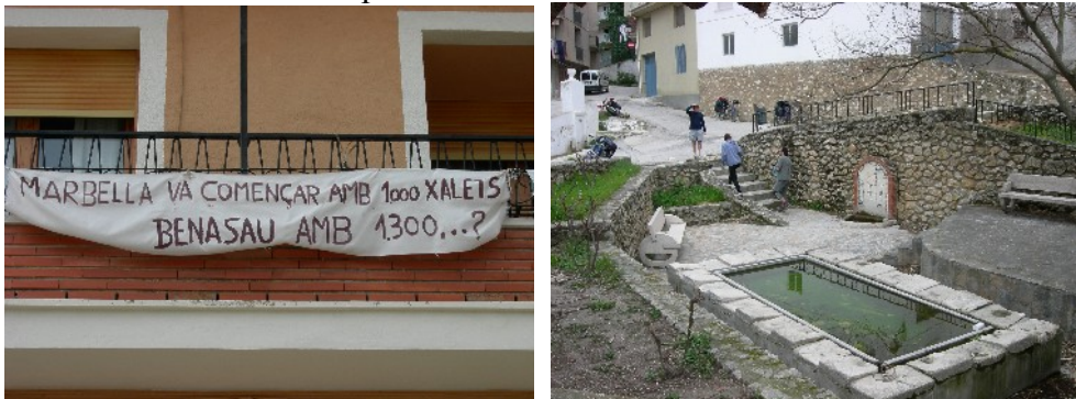
El Comptat, protesta veïnal a Benassau i avituallament líquid a Gorga

Atravessem tota la comarca del Comptat, pobles amb encant i ben conservats, Alcoleja, Gorga, Benillup, Planes de la Baronia, Beniarrés... tot conserva un aparent equilibri. A Benassau, però, constatem que no hi ha res segur. El poble és ple de pancartes de protesta, els veïns ens expliquen que hi ha un projecte per construir 1300 xalets, canibalisme urbanístic en estat pur.