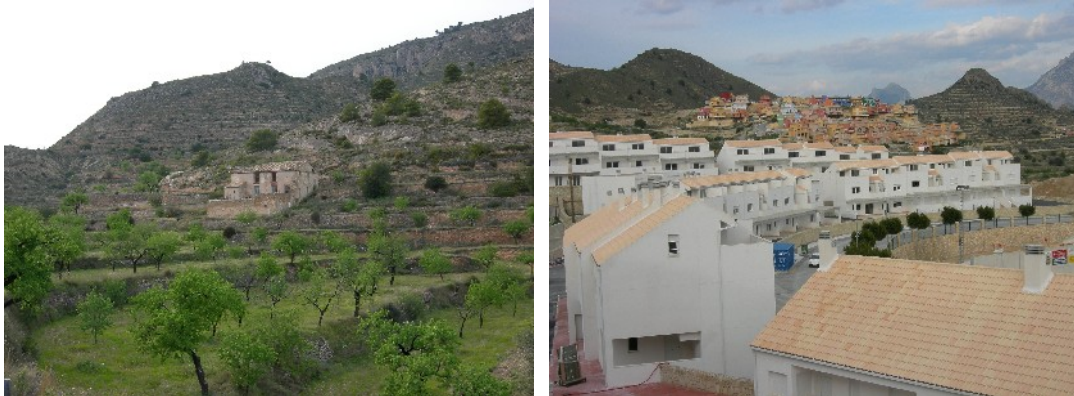
Relleu de la Marina, antics conreus d'atmetllers i nous conreus de cases

Primers quilòmetres damunt la bicicleta, sortida d'Alacant cap a Mutxamel, i l'aparició de la llengua en alguns rètols de botigues. Seguim cap a l'interior, encara en la zona d'influència d'Alacant. Bonalba i Busot, municipis en plena explosió constructiva. Competència de rètols gegants que sense cap pudor, anuncien conjunts residencials, exclusivitat, vida nova... Certament el bum de la construcció actual al País Valencià és d'una intensitat desmesurada, agresiva i barroera, però relativament recent, com així denoten les construccions. Al Principat portem anys acumulant el pòsit d'un creixement potser no tant intens però sí sostingut, amb un litoral que fa pena...si fa no fa està igual de patètic.