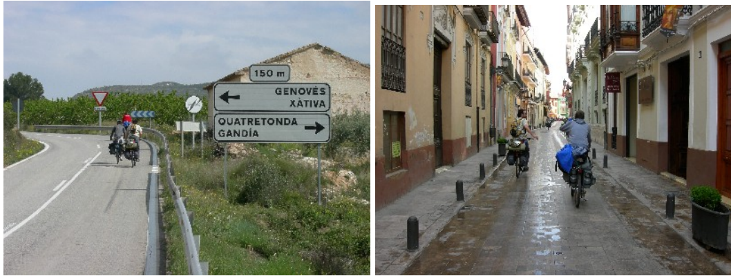
Arribada a Xàtiva i visita ciclística per la ciutat

Pedalem olorant l'agradable aroma que desprenen les desenes de milers de taronjes a banda i banda de la carretera. Creuem l'autopista a l'alçada de Massalavés, poble força desolat on convida a passar de llarg. L'Alcúdia de Carlet està engalanada amb motiu de la setmana santa. Ens fixem que és el municipi, on hi ha una major presència de rètols en valencià, i també una nomenclatura de carrers ben coherent, amb referències a Vicent Andrés Estellés o al País Valencià. Seguim fins a Carlet, ciutat amb un centre bonic i els afores experimentant un fort creixement. Dormim en un hostel de carretera, durant la nit torna a fer un bon ruixat.