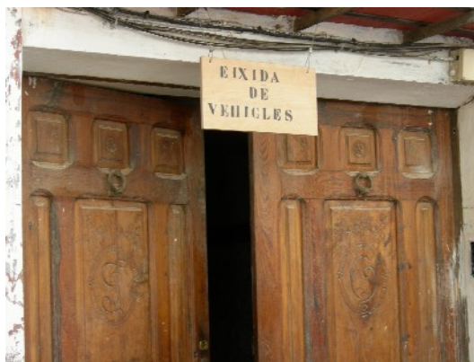
El poble de Castellfort i detall d'un rètol a Cincorres

Seguim ben enlairats amb algunes pastures infiltrades en el bosc. De cop, l'altiplà s'acaba, la carretera s'aboca cap a la vall que jerarquitzava el riu Tastavins. Apreciem uns ports més trencats, el relleu es recargola, muntanyes tallades per barrancades, cingleres interrompent la massa forestal.