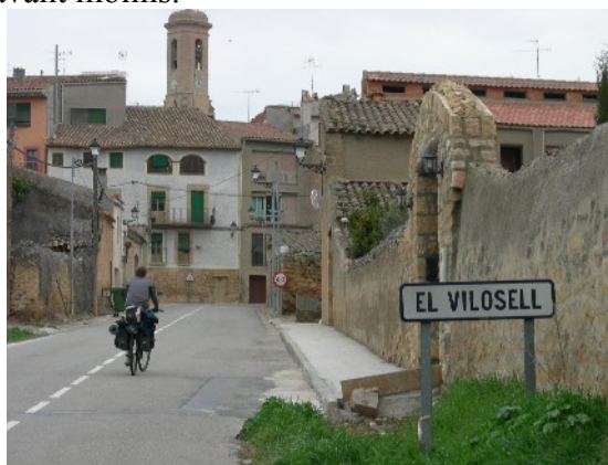
Ritme pausat i pobles endreçats al Priorat i Les Garrigues

Seguim per Fullella i l'Espluga Calva, on destaca el seu castell, fins a l'Urgell. Canvi de paisatge. Entrem al país del ferratges i els cereals. Els camps són verds en oposició al blau fosc de la nuvolada. Contrast de colors que entretenen la ruta. Tenim una mica de vent de cara, però l'orografia de la comarca, permet menjar-nos quilòmetres. Maldà, Sant Martí de Riucorb –amb la font també sense aigua- Tàrraga i La Segarra. Terra de transició, tant en els assentaments humans com en la vegetació.