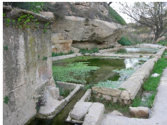
Creuant el riu d'Algars en plena crescuda i detall de l'antic safareig de Batea