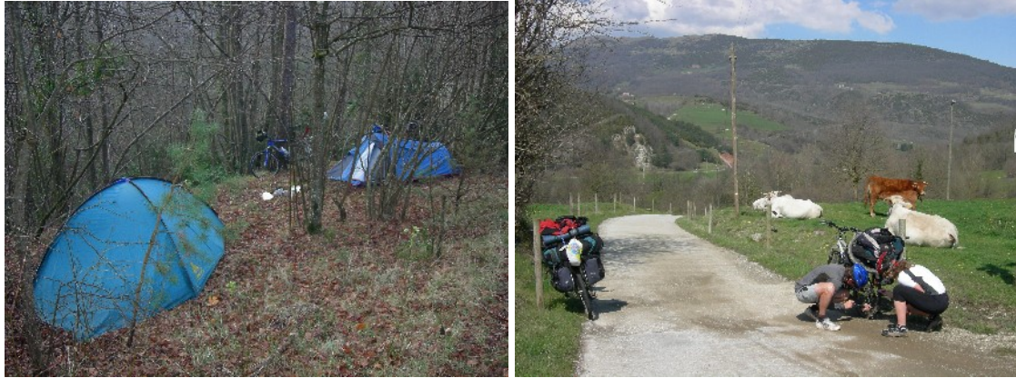
Acampada sobre la fullaraca i contratemps mecànics al pas pel Ripollés

Camprodon i Molló, municipis abocats al totxo, i que inevitablement són decepcionants recordant els que hem vist pel sud. Ja havent aniquilat la costa principatina, ara el Pirineu és el botí. De fet que és pot esperar si un conseller “progressista” del govern és dels màxims impulsors de la urbanització del Pallars.