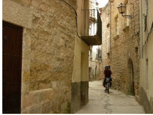
El Matarranya conserva pobles amb molt d'encant. A les fotos Vall-de-roures i Cretes

De Calaceit, per evitar la carretera principal, agafem una pista que ens porti fins al mas d'Algars. Camí a través de conreus i feixes on s'alternen vinya, olivers i ametllers. Tots ells plenament acius. Un paisatge mediterrani ben viu. La pista davalla fins a la llera del riu d'Algars, que està molt crescut. Per creuar-lo haurem de descalçar-nos i passar a peu, hem deixat enrera el Matarranya. Enllacem amb la carretera de Batea que està en obres. Arribem al primer poble del Principat, avui ja portem 90 quilòmetres. Aturada al Casal. Som a la terra del vi, ens demanem una mistela amb efectes regeneradors immediats.