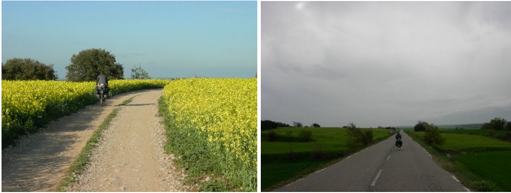
Varietat cromàtica travessant la Segarra

El matí s'aixeca definitivament amenaçant, la llevantada ,avui sí, es deixarà notar. Cal espavilar-se. Sant Guim de La Plana, Vicfred, Ivorra... el relleu s'ondula, un paisatge fet a pinzellades, gran varietat i el cel cada cop més fosc. Seguim fins Torà amb un centre històric molt atractiu. És notòria la presència d'un alt percentatge d'immigrants provinents de l'est d'Europa. La noia del supermercat s'esforça per parlar-nos en català. Un agraïment i un somriure.