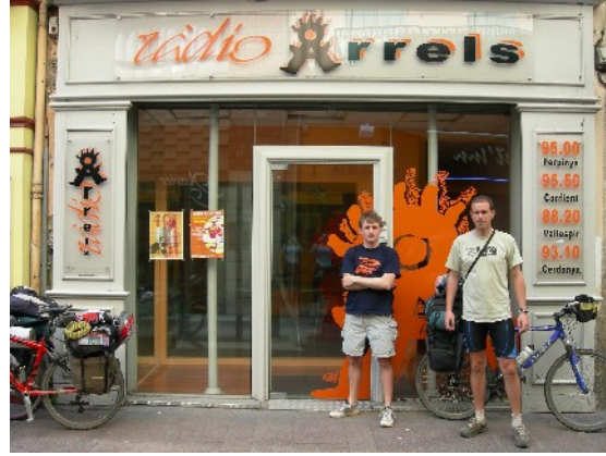
La plana del Rosselló amb el Canigó de sentinella. Dos dels expedicionaris davant de Ràdio Arrels a Perpinyà. Punt final de la travessa

Travessa realitzada del 30 de Març al 18 d'Abril de 2007