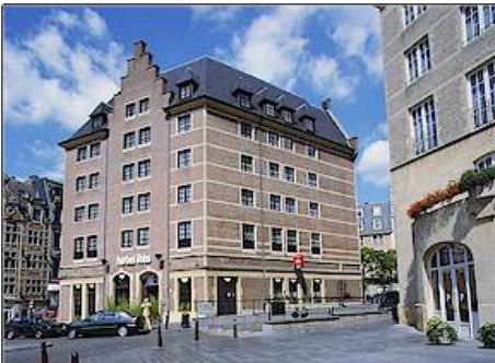
Hotel Ibis Grand Place